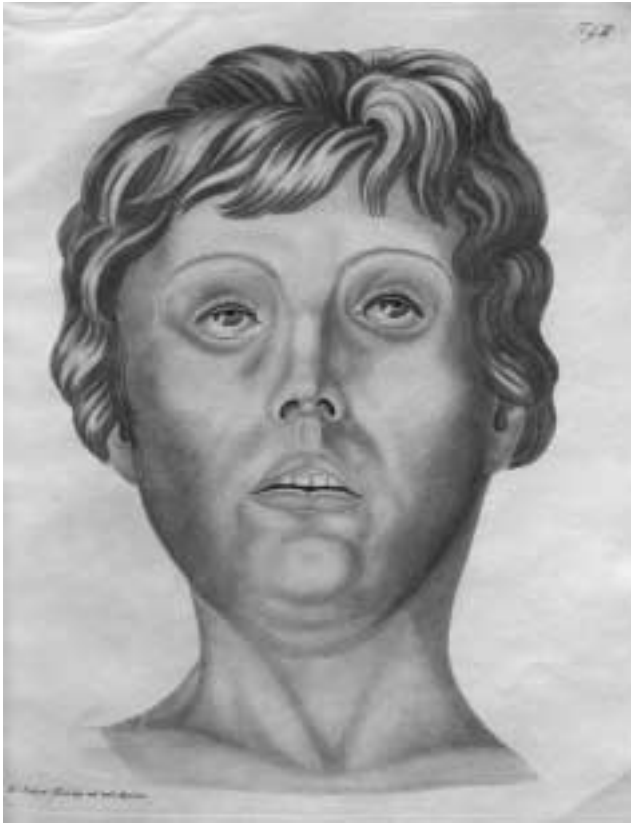
1. Afbeelding van elfjarige jongen die aan cholera overleden is uit medisch handboek uit 1832.

Zingeingsvragen ontstonden niet alleen door de hoeveelheid slachtoffers die de cholera eiste maar ook door het grillige verloop van de ziekte. Cholera begint meestal met onduidelijke symptomen, waarna snel hevige aanvallen van diarree en overgeven volgen. Een choleralijder kan dan een kwart van het lichaamsvocht verliezen. Hierdoor verloopt de doorbloeding niet goed meer, waardoor de huid blauw wordt. De ogen vallen in, en handen en voeten worden koud. Sommige patiënten herstellen na deze fase; velen overlijden echter. Vaak duurt dit proces drie tot vier dagen, maar soms overlijdt de patiënt al binnen een paar uur nadat hij de eerste verschijnselen vertoonde. 8 De cholera-bacterie bevindt zich in de ontlasting en het braaksel van een besmet persoon en verspreidt zich vooral via besmet drinkwater of water dat als waswater is gebruikt, maar ook wel door het drinken van melk, door het eten van bepaald voedsel, of van mens op mens. 9