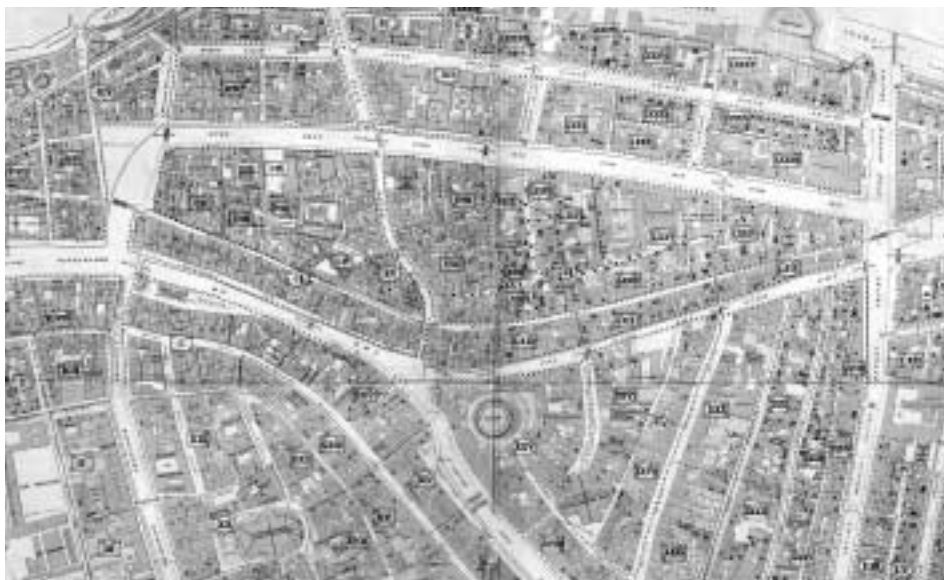
6. Plattegrond van Leiden met sterftcijfers cholera-epidemie 1866.

Oppermagtige, die alle dingen werkt naar den raad van Zijnen wil'. 59 God had de rampen gestuurd, en hij was ook de enige die troost kon bieden in deze situatie: