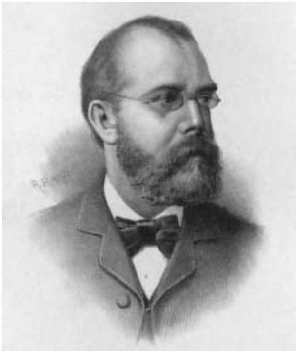
5. Robert Koch, ontdekker van de cholera-bacterie.

drinkwater, door het niet in quarantaine houden van ziek vee), en ook zelf zorg moest dragen voor de bestrijding ervan. Als iemand beweerde dat ziekte een straf van God was voor zonden, moest hij volgens sommige modernen eigenlijk ook afzien van zaken die hem beschermden tegen het krijgen van ziekten, en zo de consequenties dragen van het idee dat God hem strafte: